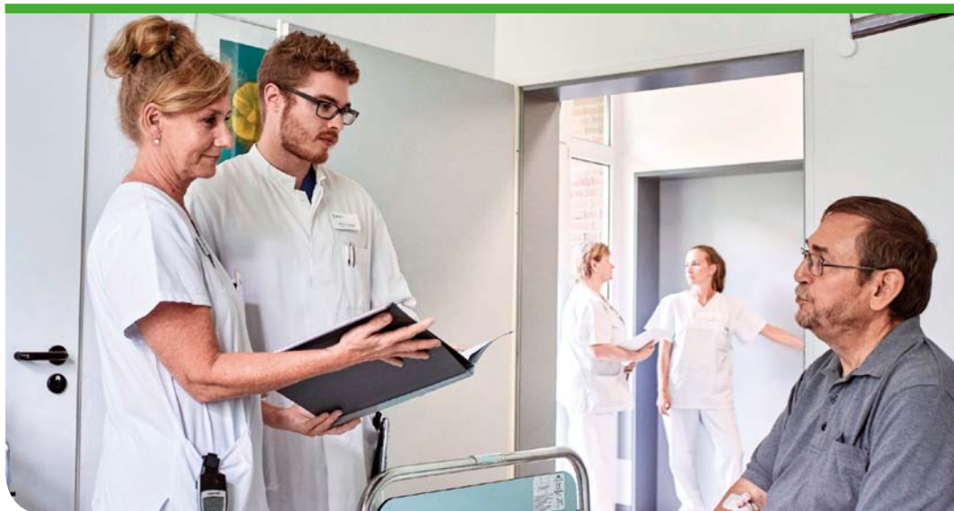
Die Zahl von Nierenzellkarzinomen wächst. Umso wichtiger sind spezialisierte medizinische Zentren.